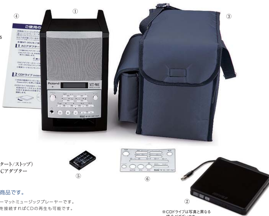
※CDドライブは写真と異なる場合がございます。

SMT-3Cは外部メディアにUSBメモリーを採用したマルチフォーマットミュージックプレーヤーです。 伴奏曲を再生し、効果的な練習ができます。付属のCDドライブを接続すればCDの再生も可能です。