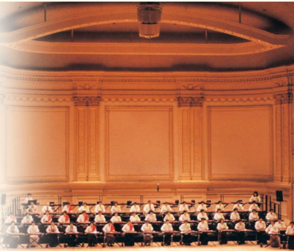
カーネギーホール演奏会