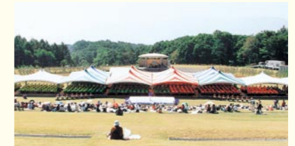
ギネスにチャレンジ 大正琴1000人演奏会