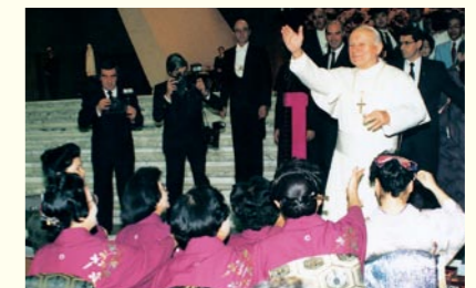
ローマ法皇謁見演奏会