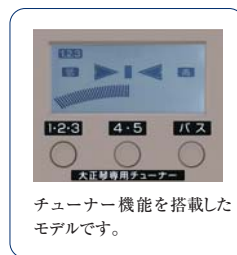
チューナー機能を搭載したモデルです。