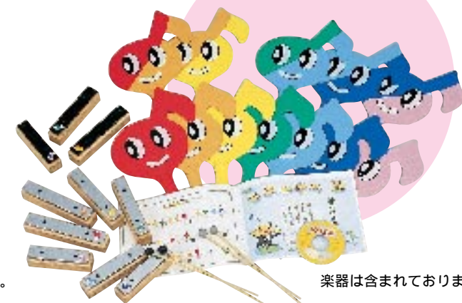
楽器は含まれておりません。