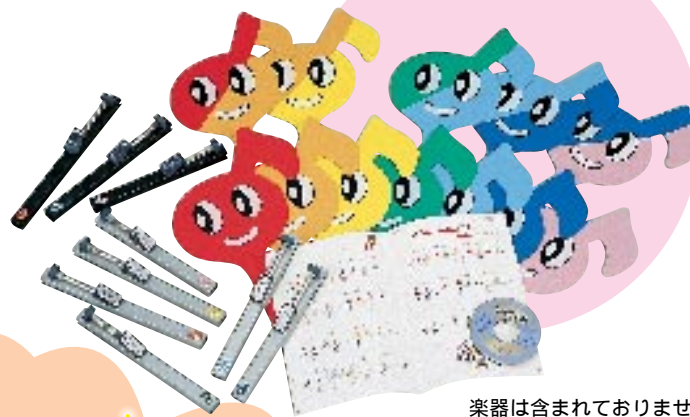
楽器は含まれておりません。