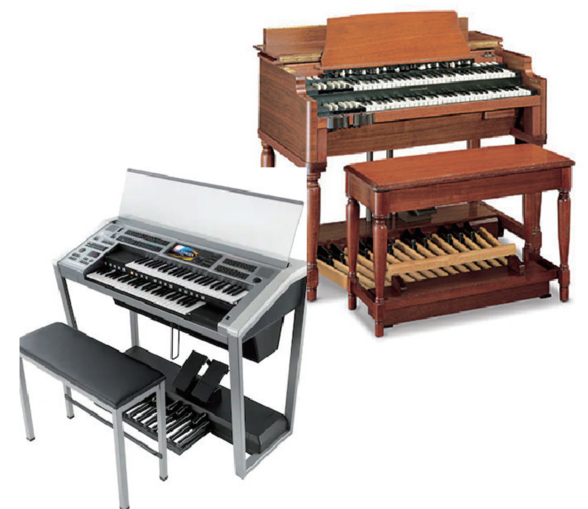
ハモンド NEWB3 とエレクトーン ELS02C 使用