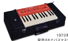
1973年に発売されたバスマスター

バスマスターはスズキオリジナルの楽器です。誕生は1973年。ある音楽発表会で電子オルガンの足鍵盤(低音)をしゃがみこんで演奏している子どもの姿を目にしました。子どもにとって、オルガンのイスに座った状態での足鍵盤の演奏は容易ではないからです。せっかくの発表会なのにみんなに顔を見せることもできずに足鍵盤を演奏している子どもを見て「誰もが演奏できるやさしい低音楽器が必要だ」との思いから開発し、誕生したのがバスマスターです。発売以来、モデルチェンジを繰り返しながら現在にいらっています。