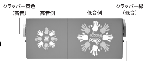
ストラップ クラッパー取り付けゴム